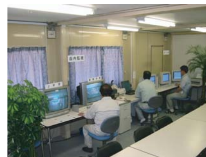
中央監査室 (情報化施工)