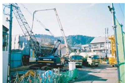
コンクリート打設状況