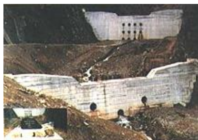
白田切川治山ダム