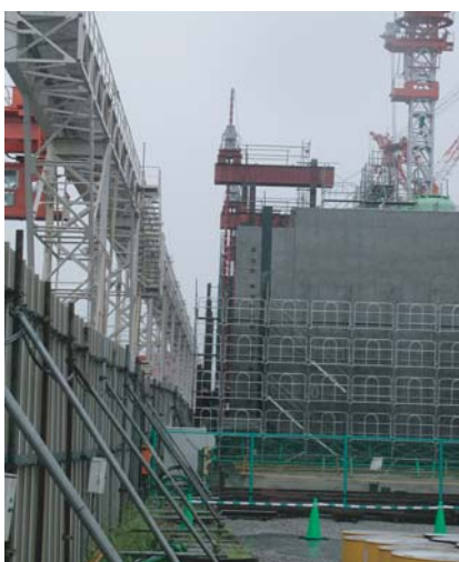
隣地クレーン設備との近接施工状況